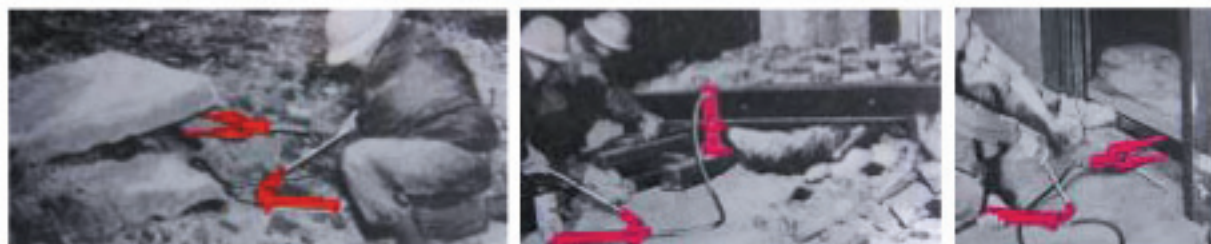
崩れたコンクリートスラブの持ち上げ(スプレッドラム使用) パイルに挟まれた人の救助 リフトに挟まれた人の救助

詳細は下記までお問い合わせ下さい。 http://www.blackhawk.co.jp/ ポートパワー は登録商標です。（類似品にご注意下さい）